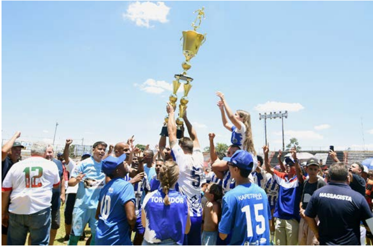
ADPM comemora título de 2025.

A ADPM ficou com o título desta temporada da Série A do campeonato varzeano ao derrotar a Vila Nogueira pelo placar de 2 a 0. A grande final aconteceu no estádio Fortaleza, na manhã de domingo (30). Nesta competição, a ADPM jogou 18 vezes, conquistou 13 vitórias, 5 empates e não teve derrotas. O time marcou 54 gols e sofreu 11 tentos. Com a conquista a ADPM ganhou troféu e um prêmio de 4 mil reais. A vice-campeã Vila Nogueira recebeu troféu e 3 mil reais. O goleiro menos vazado foi Marcus Vinicius, do Atlético Vila Diva, que faturou troféu e 500 reais. Dieguinho, da ADPM, e Pogbá, do Inter Mari-