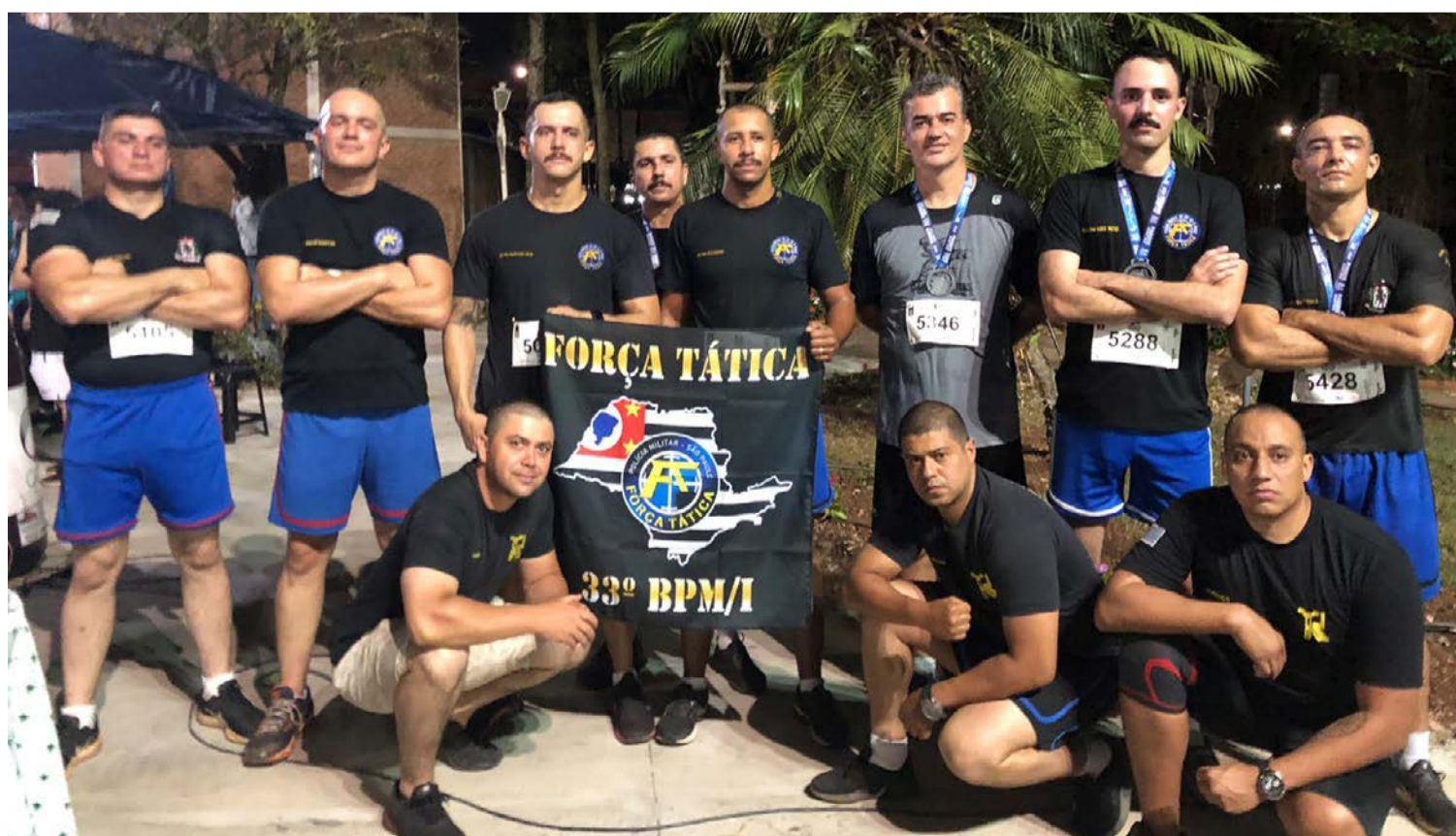
Policiais Militares da Força Tática e Cavalaria, participaram da 6ª edição do Parque Night Run. Uma forma de incentivar a prática desportiva entre a tropa, e promover aproximação com a população de bem. Sucesso!