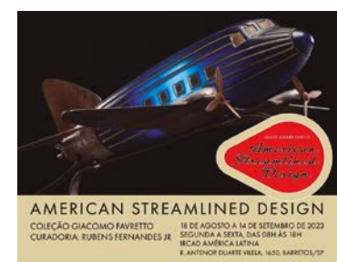
AMERICAN STREAMLINED DESIGN COLEÇÃO GIACOMO FAVRETTO CURADORIA: RUBENS FERNANDES JR. 18 DE AGOSTO A 14 DE SETEMBRO DE 2023 SEÇÃO AMÉRICA LATINA, SALÃO DE EXIBIÇÃO AMÉRICA LATINA R. ANTONIO GUARINI, 100 - BARRETOS/SP

A exposição é composta por cerca de 100 objetos. Entre eles: caixa de ferramentas Torpedo, década de 1940-EUA, produzida por Blackhawk; Rádio Talisman,