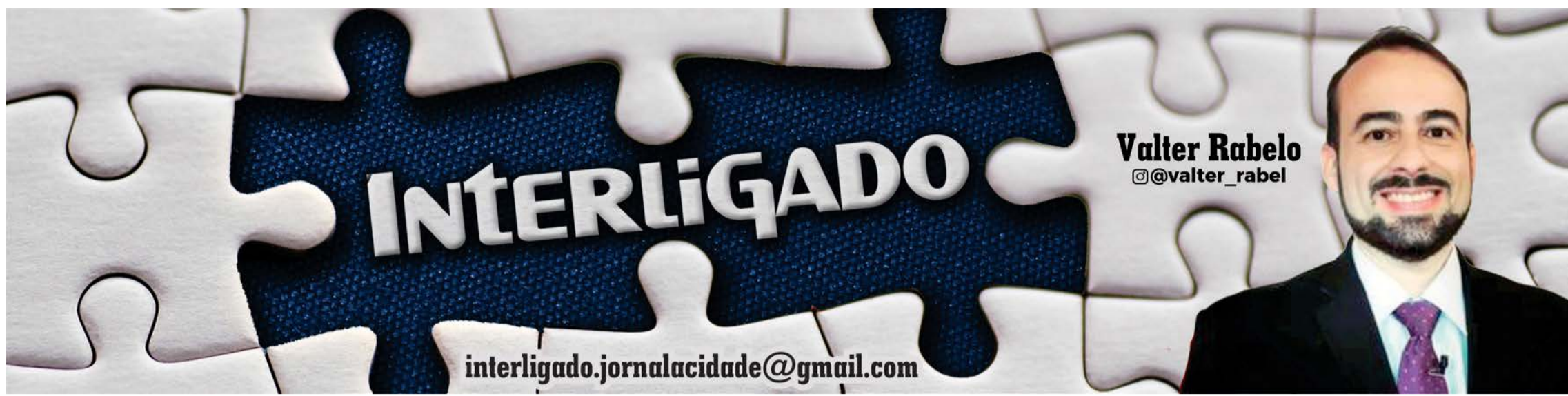
Valter Rabelo @valter_rabel