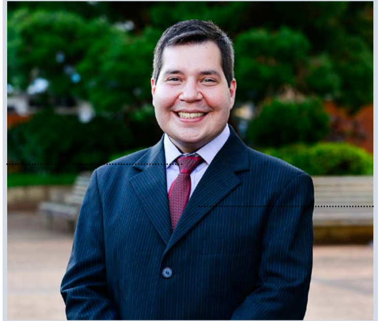
Igor Sorente é jornalista e escreve semanalmente para a coluna.

Tarcísio de Freitas (REP), candidato do Jair Bolsonaro (PL), se diz pronto para receber - num segundo turno - o apoio de quem votar contra o PT.