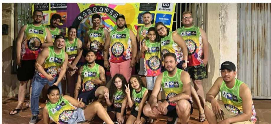
Completando 17 anos de fundação, o Bloco As Crianças, de Planura/MG, vem com tudo no Carnaplan 2024. O movimento sem fins lucrativos, foi criado com um único propósito, reunir os amigos para as comemorações de Momo, e nos últimos anos, só vem ganhando mais seguidores e conquistando prêmios, chegando a ser HEPTACAMPEÃO. Além do carnaval, o bloco tem caráter solidário, todos os anos, arrecada alimentos e distribui para entidades de cidades vizinhas, até mesmo em Barretos. Apesar do nome Bloco As Crianças, sua formação são a maioria de adultos, que são eternas crianças que adoram viver esse momento mágico que é o carnaval de rua de Minas Gerais. E para este ano, o lema é "Todos os Blocos unidos em HARMONIA por um Carnaplan melhor". As novidades e programação do Bloco podem ser conferidas pelo Instagram @bloco_ascricancas. Tudo de bom!