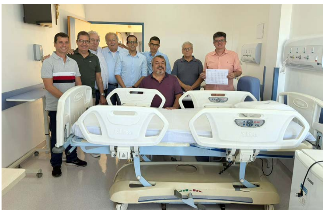
O Ingresso Solidário da 70ª Festa do Peão de Barretos destinou recursos para a reforma de quatro apartamentos da Santa Casa de Misericórdia de Barretos. Dois quartos já foram entregues e outros dois estão em fase final de obras, reforçando a parceria solidária entre Os Independentes e a instituição em benefício dos pacientes do hospital.