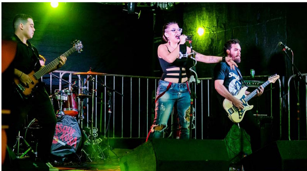
O Barretos Motorcycles 2026 anuncia a programação do Tenda Motor, com mais de 17 atrações, incluindo bandas regionais e independentes, além de shows de Mammoth Riders, Legião Urbana Tributo, Cama Brasileira e Mavericks. O evento acontece de 30 de abril a 2 de maio no Parque do Peão, em Barretos, reunindo música, motociclistas e experiências completas para o público.