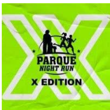
A X Edition Parque Night Run acontece dia 7 de março em Barretos, com corridas de 5 km, 10 km e 21 km, além de caminhada. Com inscrições esgotadas, o evento celebra os 10 anos da corrida mais querida da cidade. Sucesso aos organizadores!