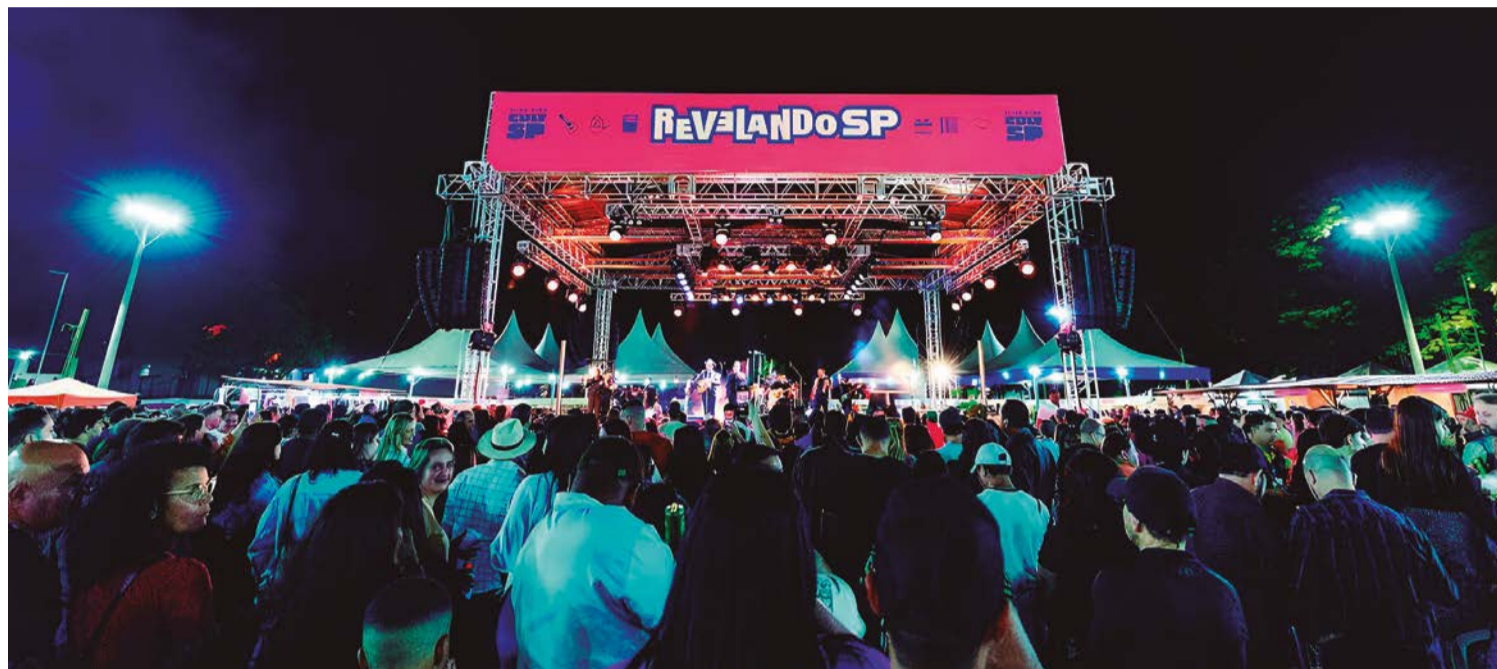
Palco do Revelando SP Barretos em 2025

A Tereos, uma das líderes globais nos mercados de açúcar, etanol, energia e amidos, ampliou o prazo de inscrições para o programa de estágio Jovens Talentos. Agora, estudantes universitários têm até o dia 14 de maio para se candidatar a uma das mais de 100 vagas oferecidas pela companhia. As oportunidades estão distribuídas entre as unidades da empresa em Tanabi (SP), São José do Rio Preto (SP), Guaraci (SP), Olímpia (SP), Colina (SP), Guaiara (SP), Palmital (SP) e no Centro Logístico no Rio de Janeiro (RJ). Voltado a alunos a partir do terceiro semestre de cursos como Engenharias, Administração, Direito, Comunicação, Economia, Marketing, Tecnologia, entre outros, o programa tem início em agosto, com duração inicial de 11 meses e possibilidade de renovação, conforme o período acadêmico. Ao longo da jornada, os participantes passam por uma trilha estruturada de desenvolvimento e executam um projeto prático alinhado à área de atuação. O programa oferece bolsa-auxílio compatível com o mercado, além de benefícios como vale-alimentação, vale-refeição ou refeitório (dependendo da unidade), transporte ou fretado e assistência odontológica. O processo seletivo inclui etapas online e entrevistas.