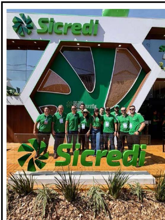
O time da Sicredi Aliança PR/SP marcou presença na Agrishow 2026, reforçando seu compromisso com o desenvolvimento do agronegócio e o apoio aos associados.