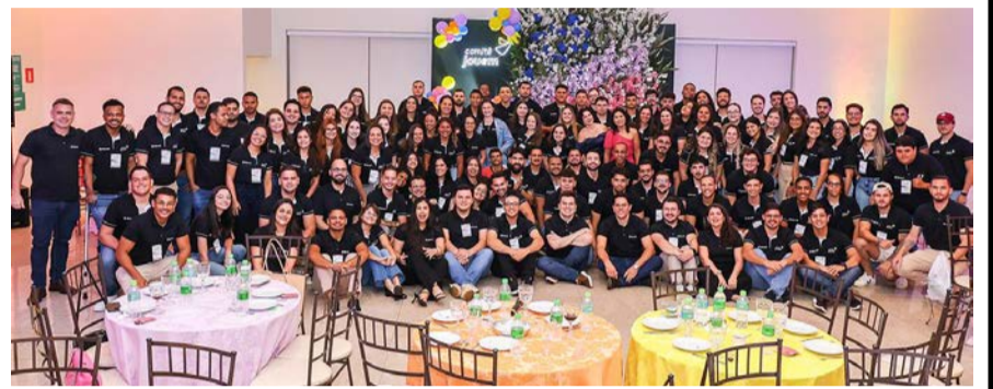
Nos dias 27 e 28 de abril, Barretos recebeu os Comitês Jovem e Mulher da Sicredi Aliança PR/SP, reunindo mais de 270 participantes em momentos de aprendizado e troca. Em destaque, temas como Inteligência Artificial e trabalho em equipe, reforçando o compromisso com o desenvolvimento, integração e protagonismo.