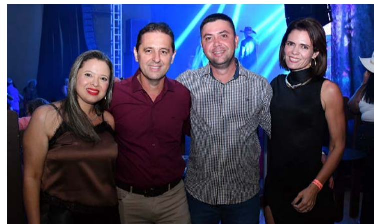
O evento "As Lendas" reuniu grandes nomes da música no dia 25 de abril, no Salão Nobre do Rio das Pedras, com shows de Durval & Alladin, As Mineirinhas e Mirian & Camila. A noite foi marcada por muita animação e contou com registros do fotógrafo Jânio Munhoz.